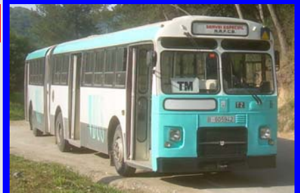
Para desplazarnos utilizaremos como siempre nuestro vehículo histórico, Pegaso 6035A nº 16