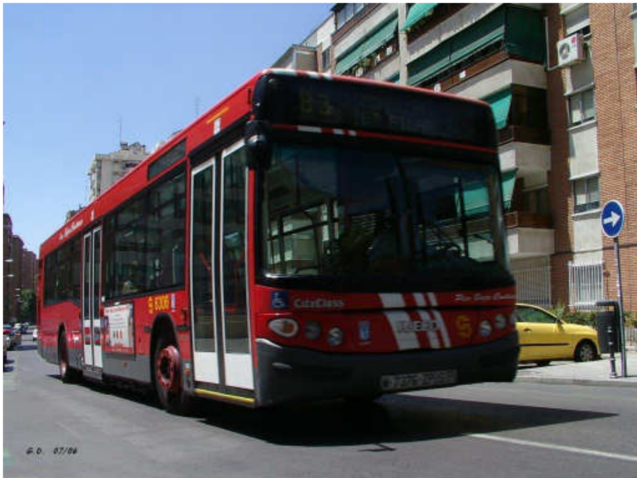
Autobús número 6306, uno de los Iveco CityClass Castrovia CS-40 City II traspasados recientemente de la cochera de Entrevías a la de Fuencarral-A.