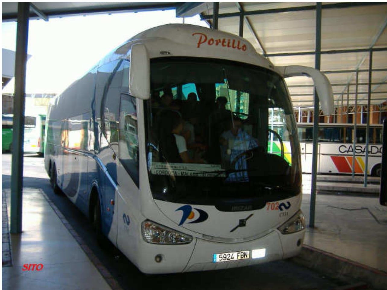
Imagen del recientemente adquirido autocar número 702 de la flota de CTSA-Portillo, S.A., un Irizar PB con chasis Volvo B12B de tres ejes matriculado como 5924-FBN.