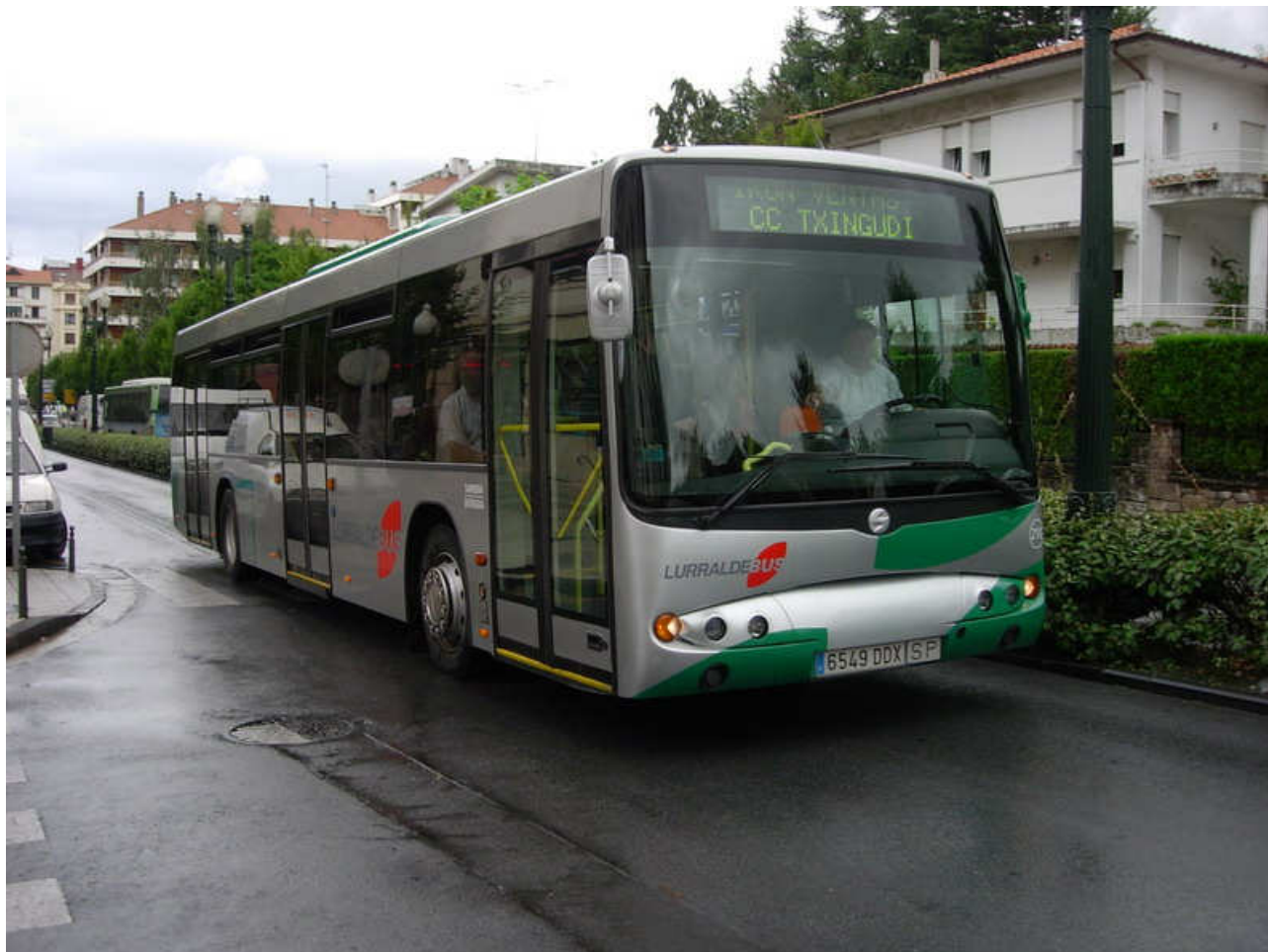
Irún. 28-7-2006.

El Volvo B7L con carrocería Sunundegui CityStylo II, número 210 de AUIF, luciendo su nuevo esquema de pintura por las calles de la ciudad de Irún.