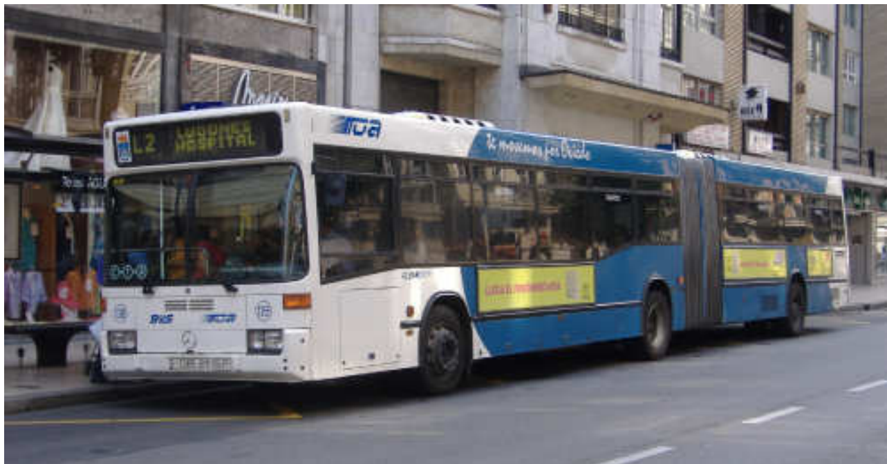
Los vecinos esperan la ampliación de los servicios de TUA en su barrio.