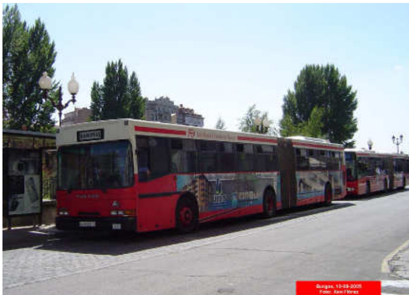
La última agresión a conductores de Autobuses Urbanos de Burgos se produjo en el último servicio de la línea 1, que une la Avenida del Arlanzón con el barrio de Gamonal.

A las agresiones, se suman además los actos vandálicos (pintadas, cristales rallados y rotura de asientos) que sí son más frecuentes y que acarrearán grandes pérdidas económicas al Servicio.