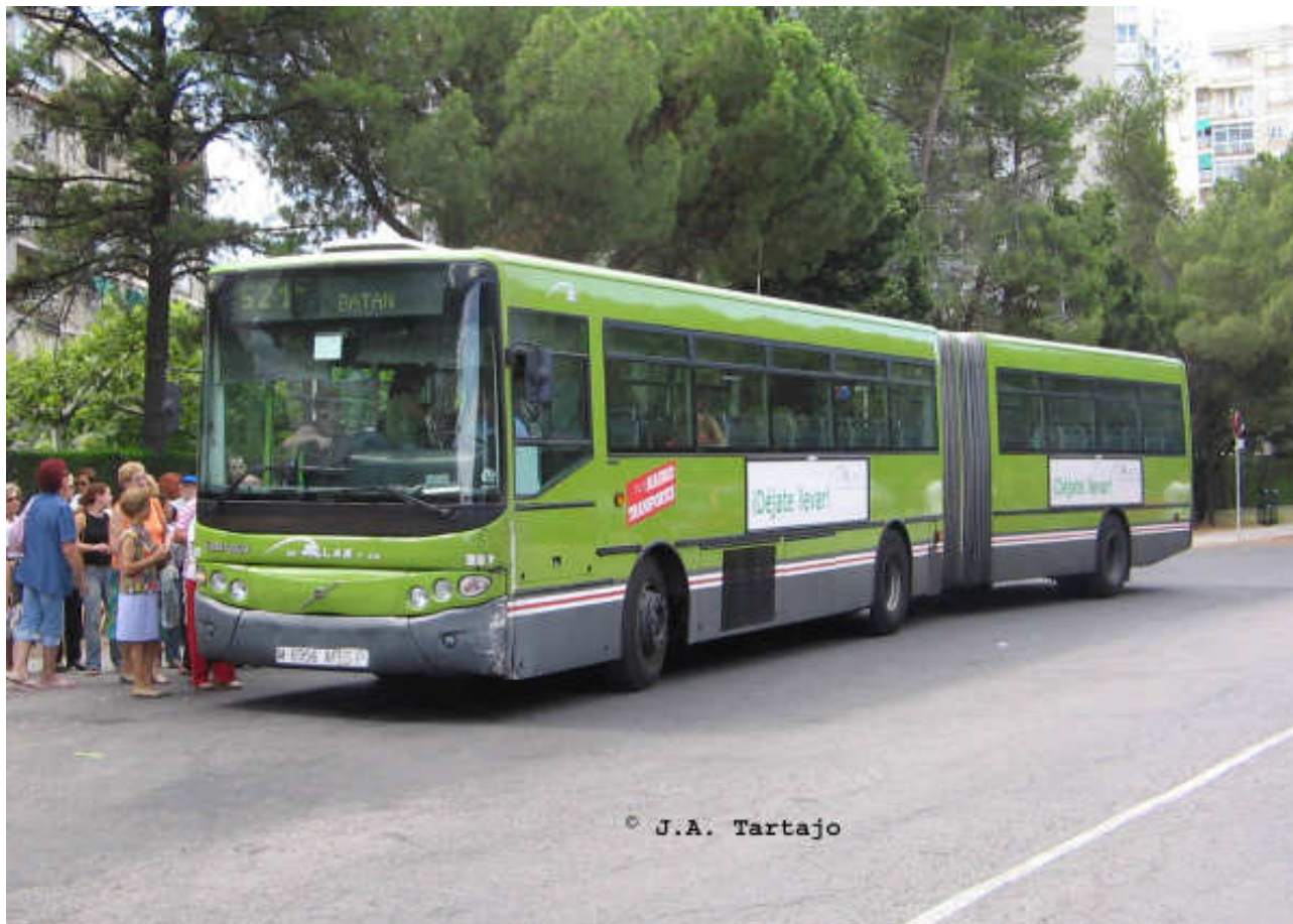
Imagen de uno de los autobuses articulados asignados a la línea 521C, el 337 de la empresa De Blas y Cía, un Volvo B10MA con carrocería Castrosua CS-40 InterCity II.