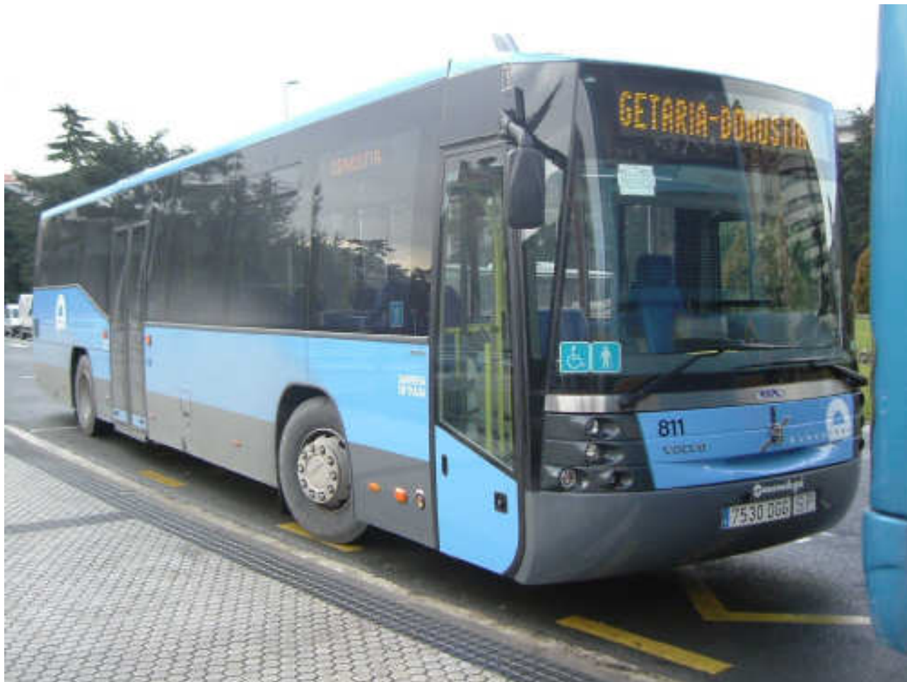
Imagen de uno de los Volvo B12B con la carrocería interurbana de Sunsundegui (modelo Astral) que adquirió el pasado año 2005 EuskoTren para sus líneas en la zona de Gipuzkoa.