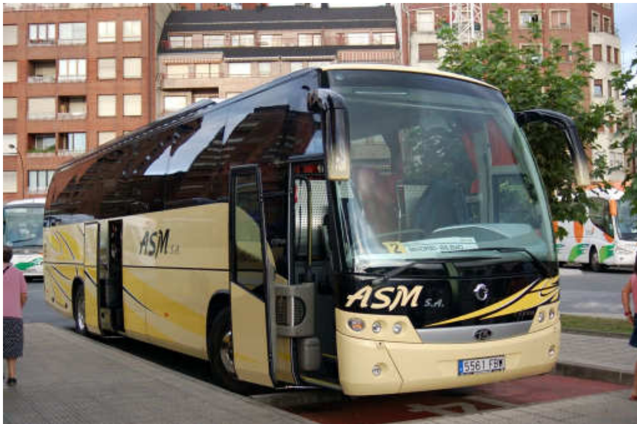
Imagen del nuevo autocar de ASM, en la estación terminal de Bilbo después de realizar un refuerzo de la línea Madrid-Bilbo de Continental Auto.