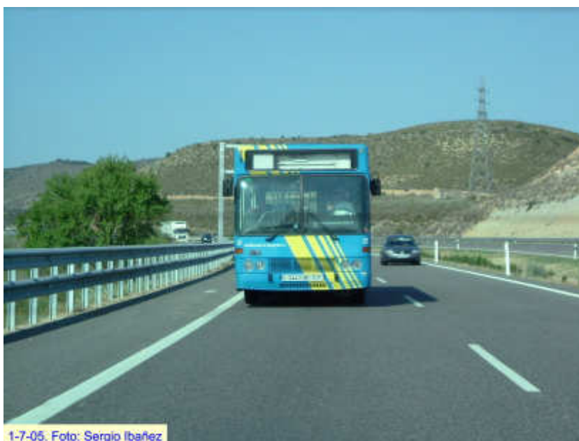
Autobús del Consorcio de Transportes del Nalón, fotografiado fuera de su área, en la comarca del Baix Cinca.

Los autobuses del consorcio ya realizaron pruebas puntuales con sistemas GPS el pasado año, aunque la medida tuvo carácter experimental y no se llegó a concretar en un plan coordinado de actuación. La previsión del consorcio es relanzar el plan tras el