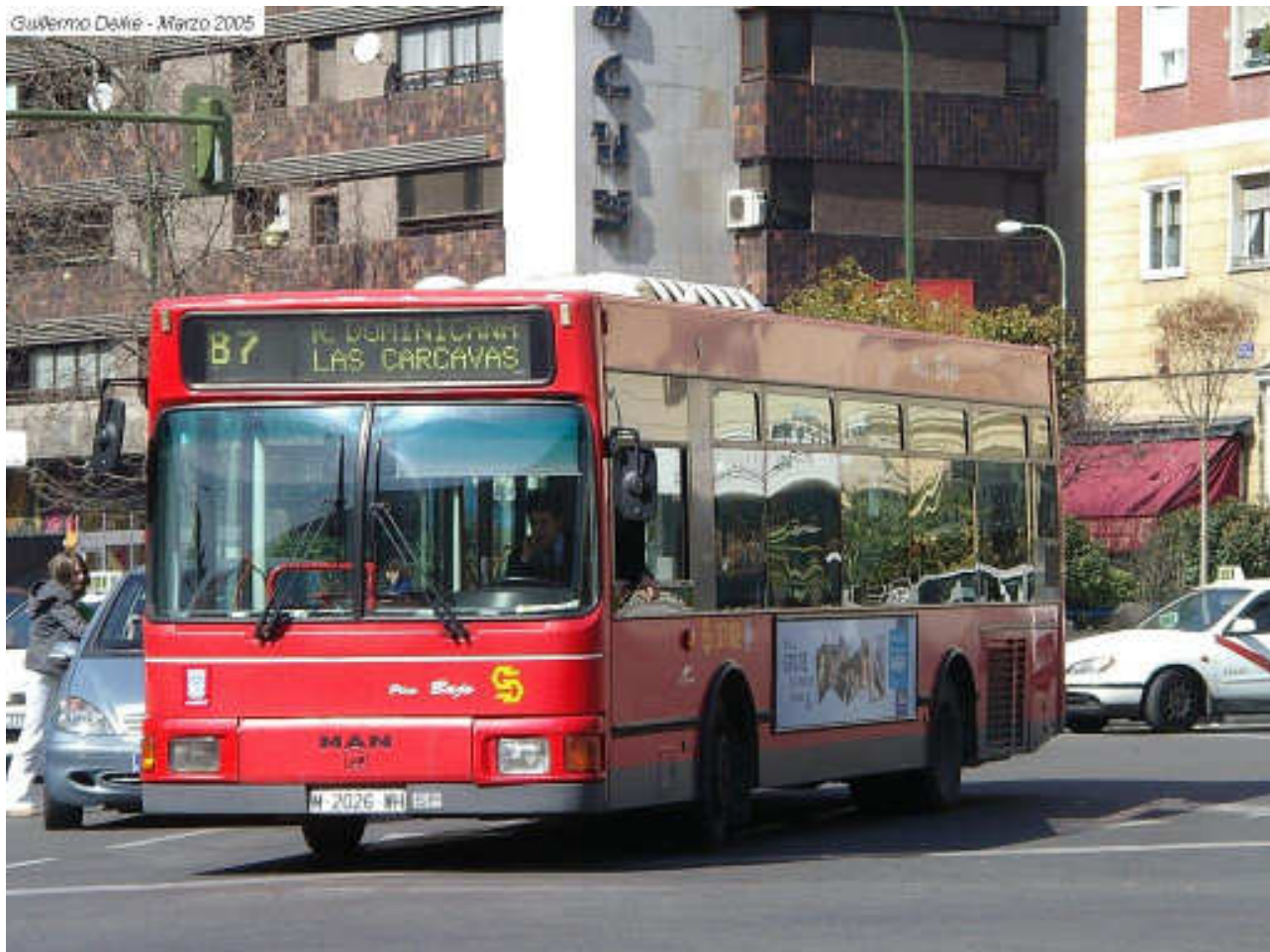
El 3702 de la EMT de Madrid, uno de los dos MAN 14.220HOCL que han sido vendidos a una empresa de Castelló.