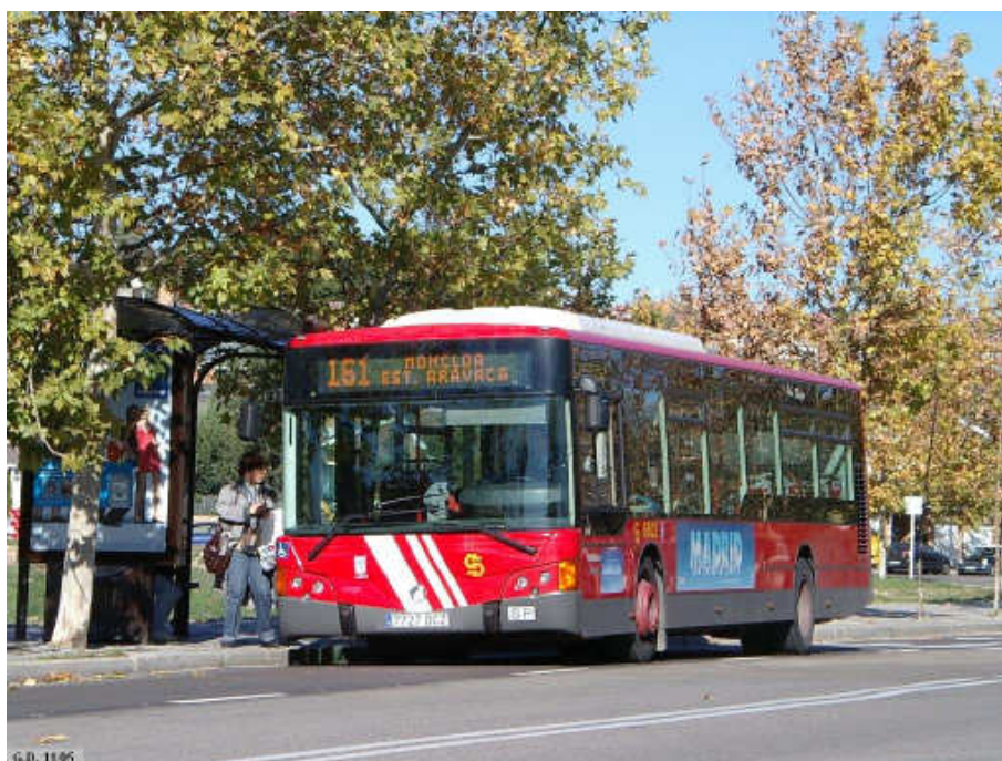
Un autobús de la línea 161: Moncloa-Estación de Aravaca, un Irisbus Iveco CityClass con carrocería Noge Cittour numerado como 6603. Esta línea ha visto modificado su itinerario con motivo de las obras que se están realizando en la Avenida Osa Mayor.

Sentido Pl. Cristo Rey: Desde la cabecera situada en la calle López de Hoyos continuará por su ruta habitual.