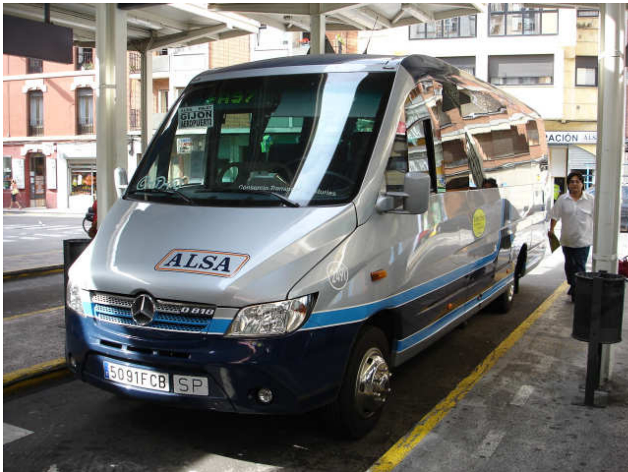
Imagen del 2491 de ALSA, un microbús Mercedes Benz O-818 Sprinter carrozado por la asturiana Ferqui bajo su novedoso modelo Salero.