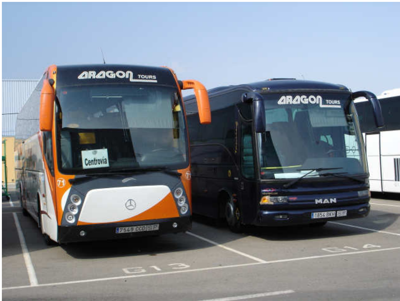
Imagen del MAN con carrocería Noge Touring, incorporado recientemente a la flota de Automóviles Zaragoza, estacionado en el exterior de las instalaciones de Hispano Carrocera junto al número 71 de la misma empresa, un autocar Mercedes Benz con carrocería Hispano Divo I.