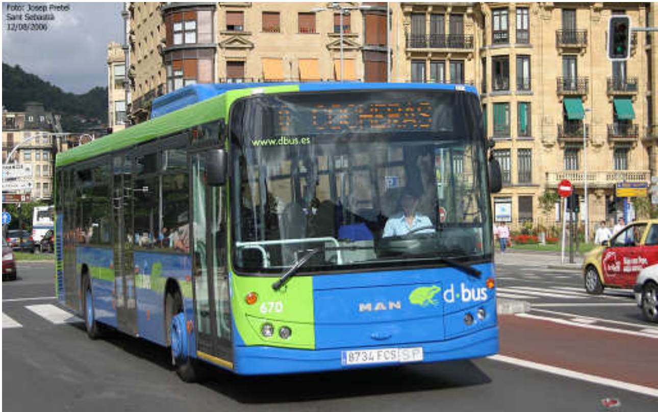
Uno de los últimos MAN en incorporarse a la flota, dirigiéndose a cochera.