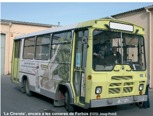
'La Cirereta', encara a les cotxeres de Forbús