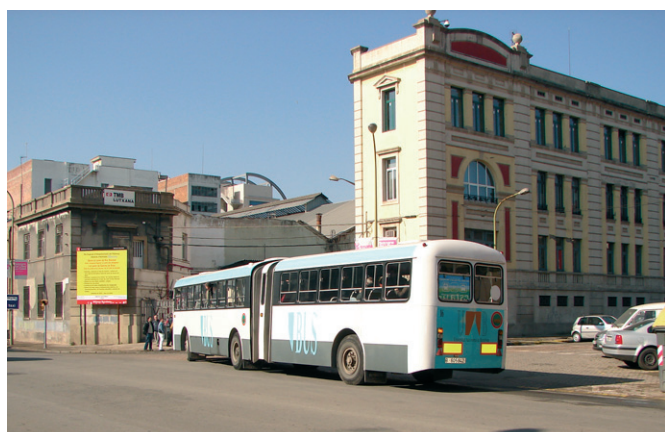
El bus de la AAFCB a la entrada de las cocheras de Lutxana