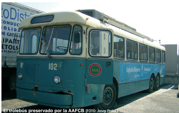
El trolebús preservado por la AAFCB