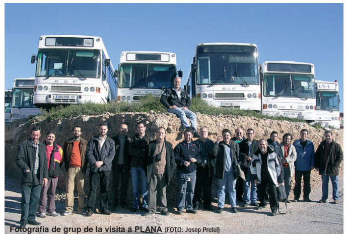
Fotografia de grup de la visita a PLANA

A continuació vam creuar la carretera i ens vam dirigir cap al segon terreny de les cotxeres, que és on s'estaciona la variada flota de què disposa i que vam poder fotografiar amb tota la tranquil·litat del món. Els que més van captar l'atenció van ser els articulats Renault PR-118 Castrosua CS-40 City procedents de l'EMT de Madrid, així com la resta d'urbans també ex-EMT Madrid.