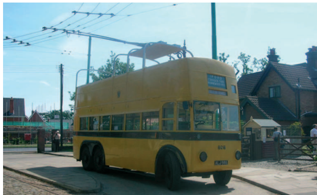
El Bournemouth 202 (East Anglia) va possibilitar que alguns de nosaltres puguéssim per primer cop en un troleibus

El nostre amable guia ens va anar ensenyant i explicant detalls de tots i cada un dels vehicles, destacant-nos al final tant el Routemaster RM3 (al qual el museu va reconstruir fa poc i partint de zero la graella frontal prototipus que va portar, i sense disposar de plànols!) com el Guy Arab Utility TT351 recentment restaurat.