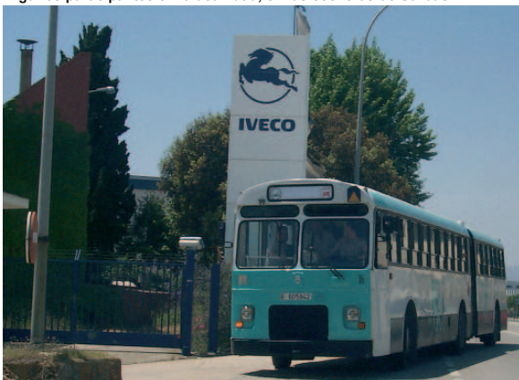
Una foto histórica para enmarcar: el 6035 de la AAFCB delante de JORSA