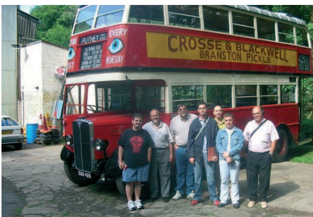
Foto de família dels viatgers londinencs, al museu de Cobham

A les vuit ja érem de nou a la carretera, en un viatge de 150 quilòmetres cap a l'est d'Anglaterra. El paisatge era preciós i ja vam trobar per la carretera algun bus clàssic. A l'arribada ens trobàvem un terreny ben delimitat,